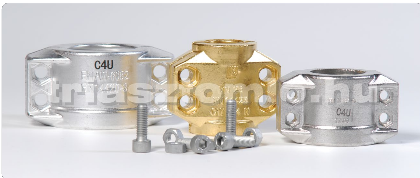
Kétrészes biztonsági szorítóbilincsek

A tömlőket fémszövettel bevonva is tudjuk szállítani. (Fémszövetes gőztömlő körmös gőzcsatlakozóval)